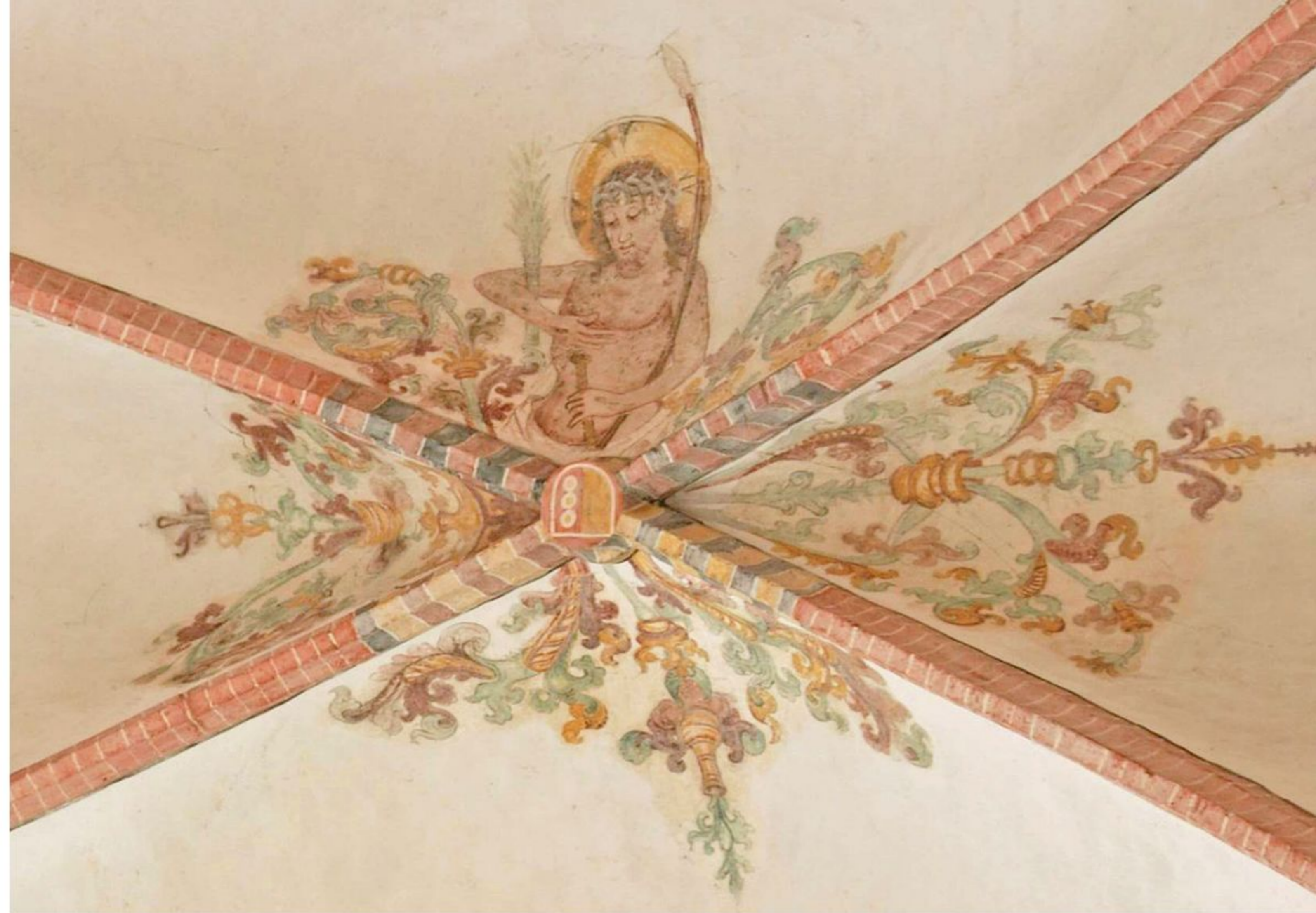
Christus als man van smarten.